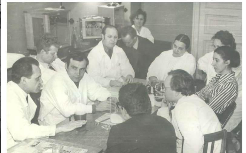
Присутствуют сотрудники кафедры биохимии и клинических кафедр