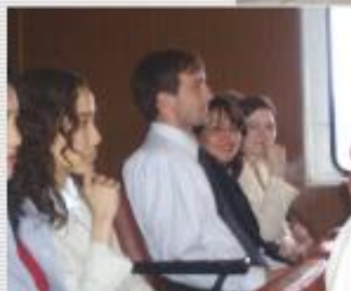
Работа на борту теплохода