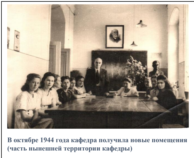
В октябре 1944 года кафедра получила новые помещения (часть нынешней территории кафедры)