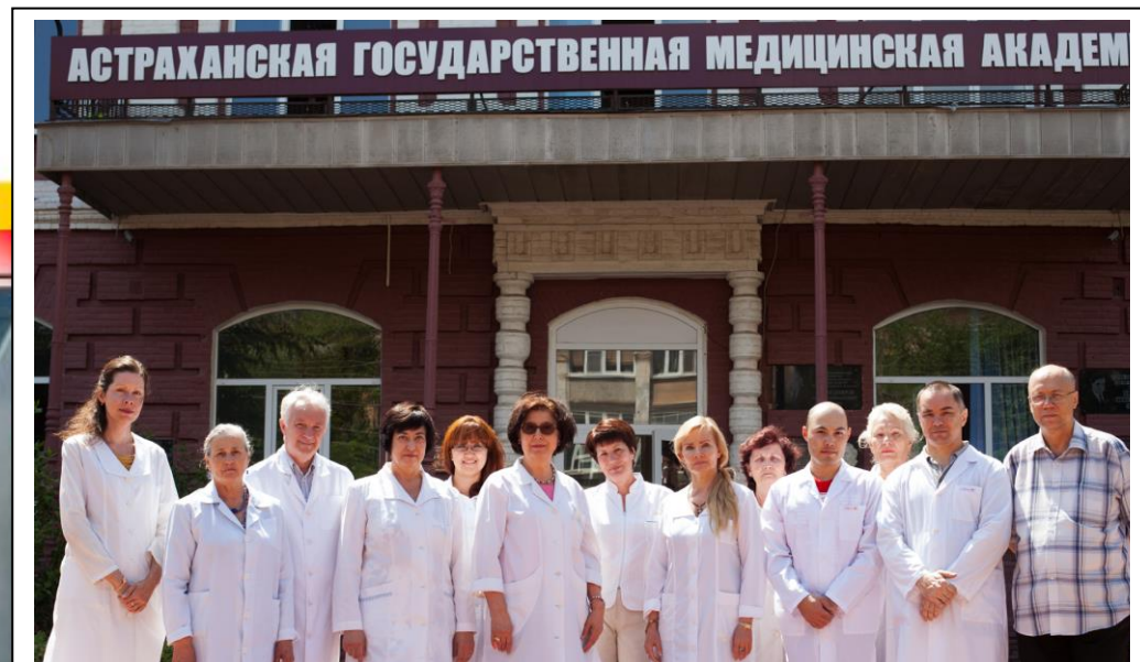
Сотрудники кафедры в 2013 году