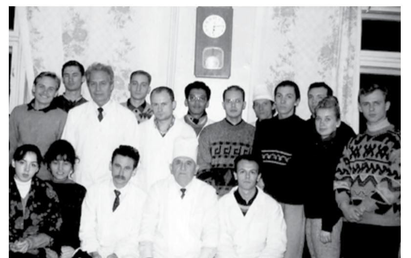
Коллектив кафедры и студенты-кружковцы (1995 год)