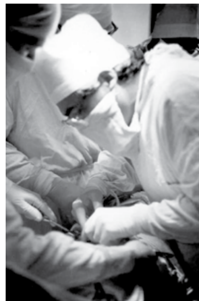
Лапароскопия (1979 год)

пищеводно-желудочных и толстокишечных анастомозов, замещение циркулярных дефектов почечных артерий аутовенозными трансплантатами с двойной стенкой, способы укрытия ран поджелудочной железы, печени, селезенки, разработаны операции по применению полимерных тканей при герниопластике, по закрытию ран печени, пластика боковых и циркулярных дефектов брюшной аорты и нижней полой вены, аутотрансплантация ткани селезенки, щитовидной и парашитовидной железы и другие. Широко используется эндовидеохирургическая техника для производства малоинвазивных