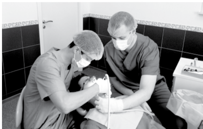
Студенты ФИС в ООО «Медицинский центр «Ориго»