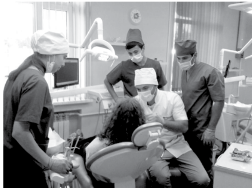
Студенты ФИС на практике в ООО «Эконом-стоматология»