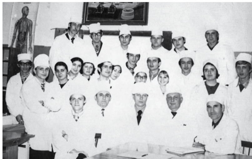
Студенческий кружок (госпиталь, 1975 год)

Учебные занятия проводятся по программам «общей», «факультетской» и «госпитальной хирургии» для студентов 2, 3, 4 и