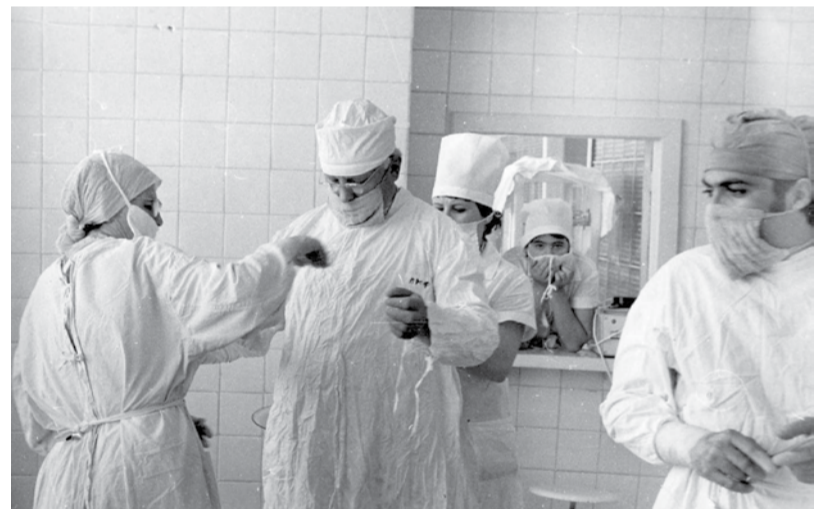
Подготовка к операции (1979 год)

достью кафедры. Однако сделано очень много. А сколько еще предстоит сделать для дальнейшего развития педиатрического фа-