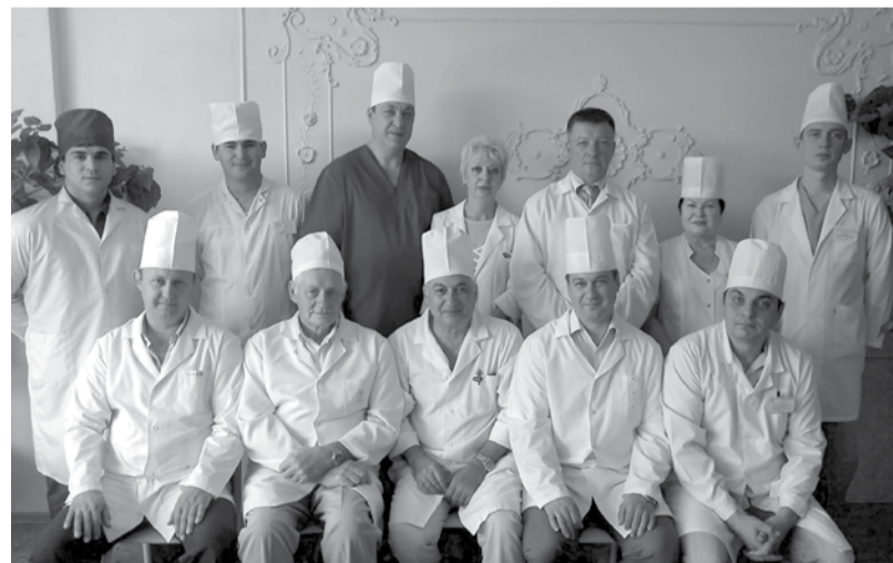
Коллектив клиники (2013 год).

Работы «Пластическая и восстановительная хирургия желудка в лечении язвенной болезни» и «Факторы риска и алгоритм прогнозирования осложнений послеоперационного периода у больных с острой хирургической патологией органов брюшной полости» были удостоены Дипломов лауреата премии губернатора Астраханской области по науке и технике.