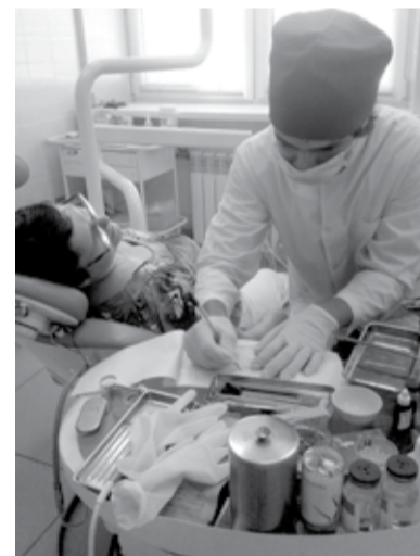
Заполнение зубной формулы ГБУЗ АО «Областной клинический стоматологический центр»