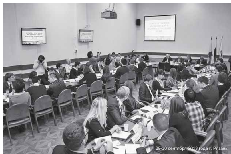
29-30 сентября 2013 года г. Рязань

Студенческий совет в новой редакции статьи 26 Федерального закона определяется как представительный орган обучающихся,