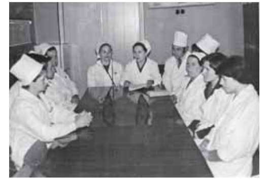
Совещание 1978 г.

эпидемиологии», 2 курса отделения «Акушерское дело» («Инфекционные болезни с курсом