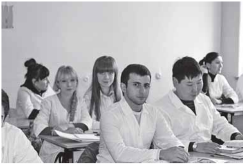
На практических занятиях