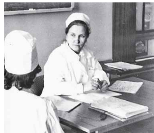
Дифзчет 1977 г.