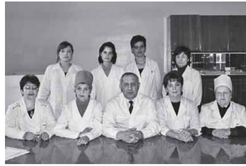
Кафедра инфекционных болезней