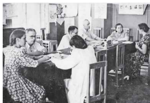
Госэкзамены 1954 г.