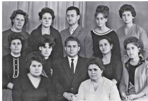
Коллектив кафедры 1967 г.