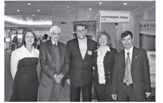
Конгресс по инфекционным болезням

фективности лечения вирусных и риккетсиозных инфекций индукторами интерферонов.