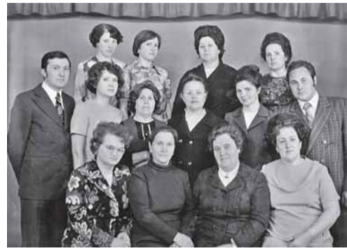
Коллектив кафедры 1978 г.

но и во всех лечебно-профилактических учреждениях города и области.