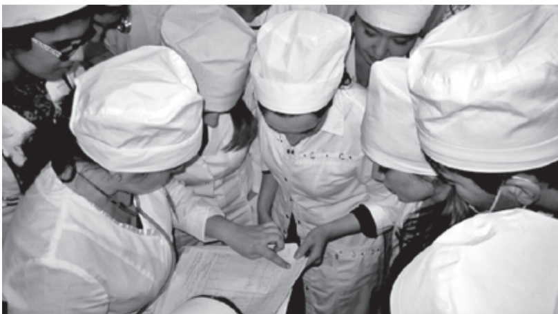
На практических занятиях студенческого кружка кафедре кардиологии ФПО в блоке кардиореанимации и интенсивной терапии отделения неотложной кардиологии ГБУЗ АО ГКБ №3