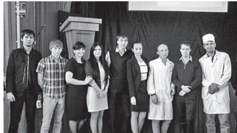
Дипломанты 95-ой Студенческой научной конференции молодых ученых и студентов АГМА (Астрахань, 2014)