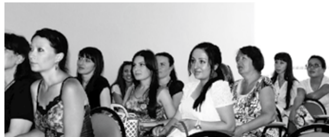
Московский Международный форум кардиологов (Москва, июнь 2012 г.)

Сотрудники кафедры кардиологии ФПО являлись организаторами проведения симпозиума «Современные тенденции