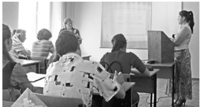
На Международной научной конференции «Инновационные технологии в управлении, образовании, промышленности «Астинтех-2012»

С апреля по июль 2012 года в системе Здравоохранения и Образования Российской Федерации проводилось несколько наиболее интересных Международных и Межрегиональных научных кардиологических конференций, конгрессов, в которых активными участниками являлись сотрудники и соискатели кафедры кардиологии ФПО АГМА.