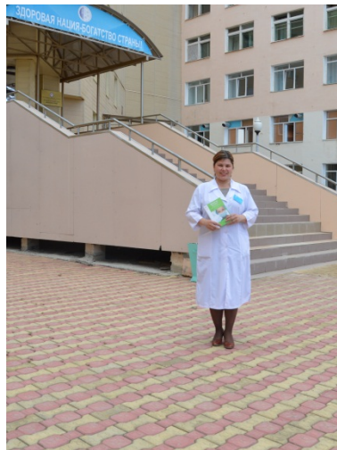
г. Якутск, Россия