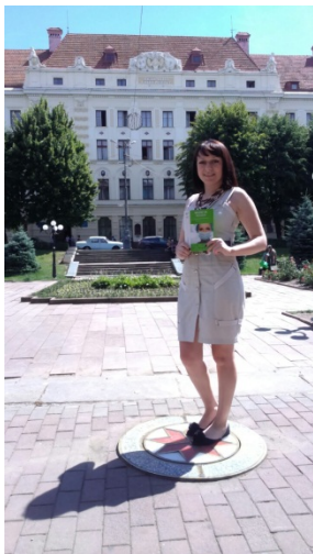
г. Черновцы, Украина