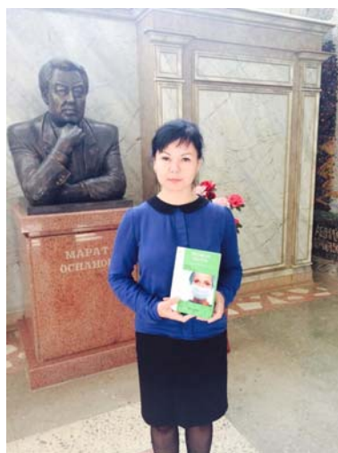
г. Актобе, Казахстан