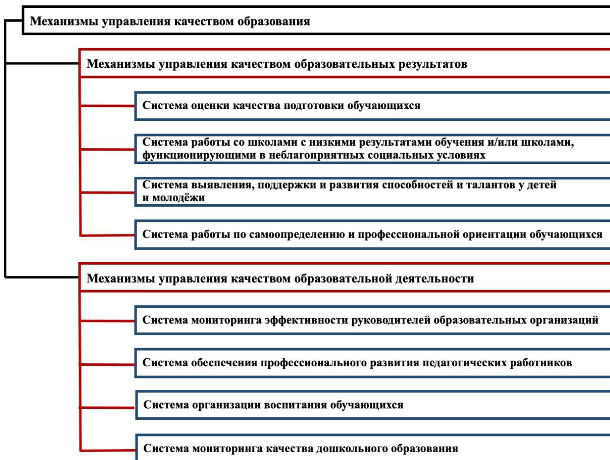
Рисунок 1 – Направления оценки

Направления Оценки представлены на рисунке 1.