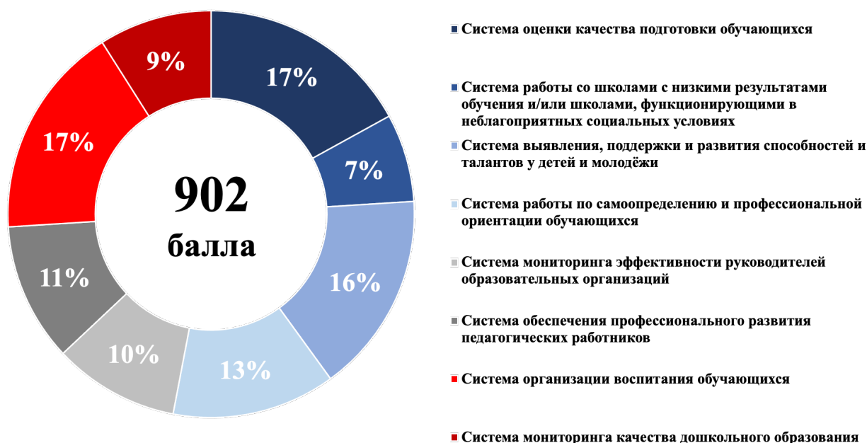
Рисунок 3 – Структура итогового балла

Максимальный итоговый балл по результатам проведения Оценки составляет 902. Структура итогового балла представлена на рисунке 3. Максимальные баллы по направлениям представлены в таблице 1.