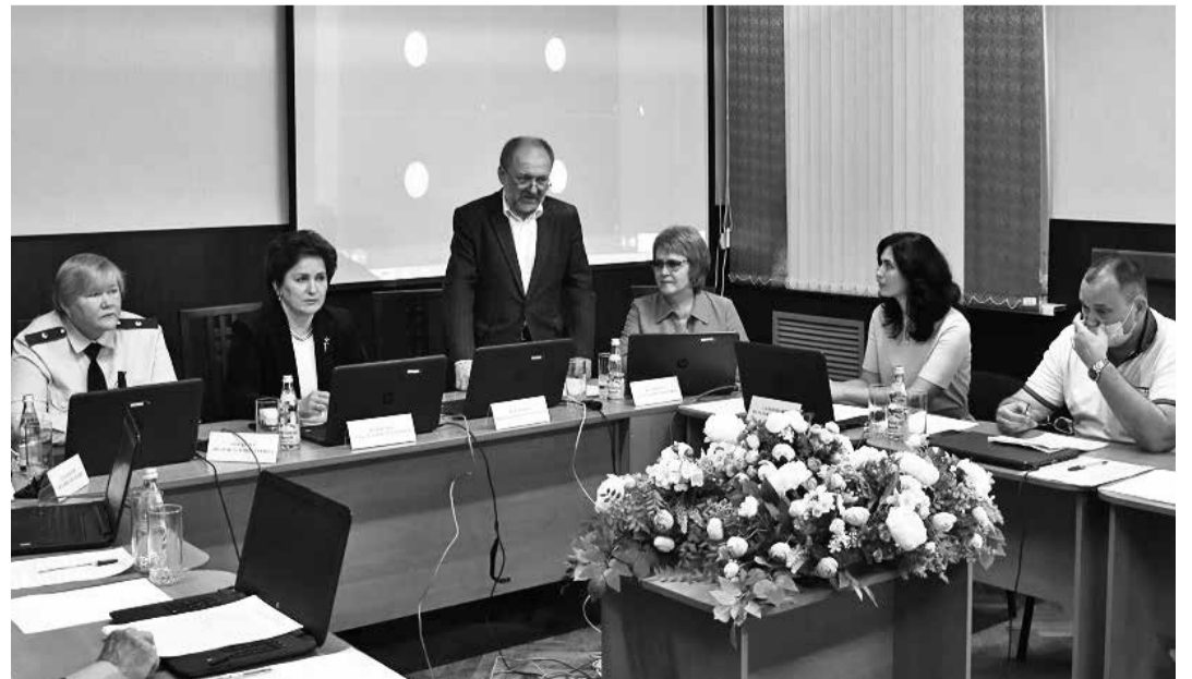
Материалы на странице подготовлены Пресс-центром

После приветственных слов участников Круглый стол продолжил свою плановую работу.